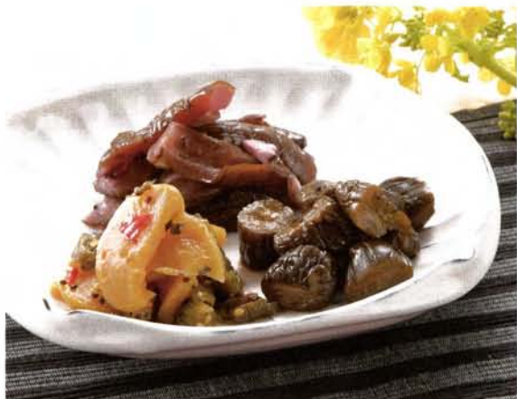
α-リノレン酸を豊富に含んだエゴマを加え、ヘルシーに仕上げました