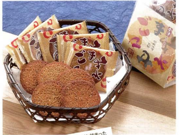
〈株オノキ食品〉 会津武者煎餅(16枚入) ————— 税込 1,050円 (A-027)

国内加工の白ごまがびっしりと詰まった せんべいは、会津産味噌の旨みが 素朴な美味しさを生み出しています。 ぱりっとした歯ごたえが人気です。 第2回(平成14年度) ふくしま特産品 コンクール 優秀賞受賞!