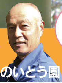
フルーツのいとう園

食べた人が笑顔 になれる。 そんなサクランボ 桃をお届けしたい と思っています。